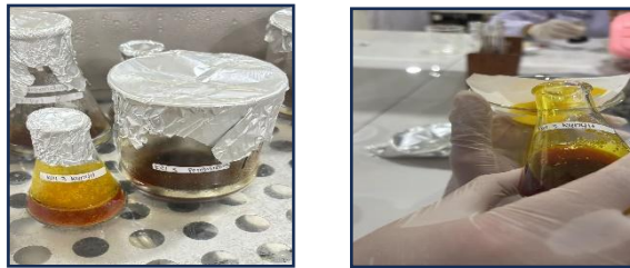
Gambar 2 Proses Filtrat Larutan Kunyit

Sampel kunyit yang telah diekstraksi menggunakan etanol 70% disaring menggunakan kertas saring untuk memisahkan ampas dari larutan ekstrak yang jernih. Filtrat hasil penyaringan inilah yang digunakan untuk uji fenolik selanjutnya, sehingga diperoleh sampel yang siap dianalisis.