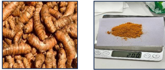
Gambar 1 Sampel Rimpang Kunyit (Curcuma Longa L.)

Sampel kunyit yang telah diekstraksi menggunakan etanol 70% disaring menggunakan kertas saring untuk memisahkan ampas dari larutan ekstrak yang jernih. Filtrat hasil penyaringan inilah yang digunakan untuk uji fenolik selanjutnya, sehingga diperoleh sampel yang siap dianalisis.