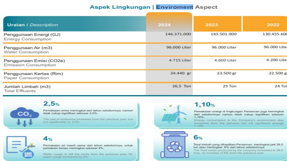
Gambar 1. Laporan SR Environmental PT Semacom Integrated Tbk

Dalam Sustainability Report Tahun 2024, PT Semacom Integrated Tbk mengungkapkan informasi terkait penggunaan energi, emisi, konsumsi air, dan jumlah limbah perusahaan selama periode 2022–2024.